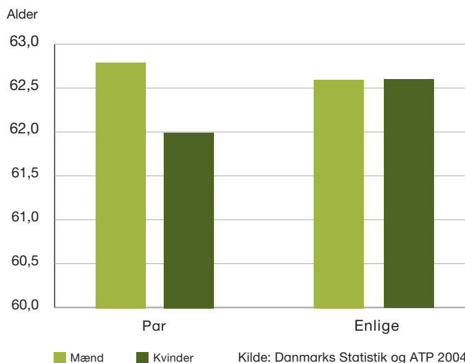
Figur 2: Parrenes tilbagetrækningsalder